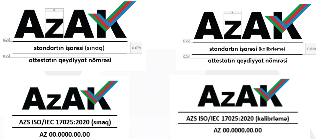
Şəkil 3: AzAK akkreditasiya nişanı

AZS ISO/IEC 17025 standartı üzrə akkreditasiyadan keçmiş sınaq və kalibrleme laboratoriyalarının akkreditasiya nişanlarında fəaliyyət sahəsi aydın qeyd edilməlidir. Nümunə aşağıda verilmişdir: