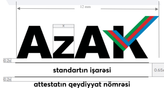
Şəkil 2: Akkreditasiya nişanı

Akkreditasiya nişanında akkreditasiya mövzusu olan standartın işarəsi və akkreditasiya olunmuş uyğunluq qiymətləndirən qurumun akkreditasiya attestatının qeydiyyat nömrəsi qeyd olunur (şəkil 2).