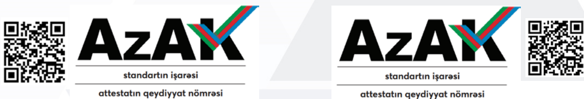
Şəkil 8: AzAK akkreditasiya nişanının AzAK-ın sənədlərinin tanınması üçün QR kod ilə erləşməsi

8.20. Akkreditasiya olunmuş idarəetmə sistemi sertifikatlaşdırma orqanları, hazırladıqları sertifikatlarda AzAK akkreditasiya nişanının yanında (solunda və ya sağında və ya üstündə və ya altında) AzAK-ın sənədlərinin tanınması üçün QR koduna (20X20 mm ölçüsündən az olmamaq şərtiylə) aşağıdakı formada yer verilməlidir. AzAK-ın icazəsi alınmaq şərti ilə digər istifadə formaları da tətbiq oluna bilər.